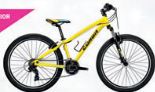
CONOR // 5200-26 // 308€