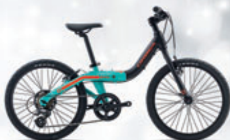
ORBEA // GROW2 // 230€