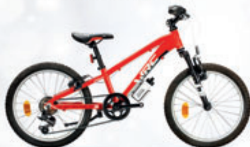
CONOR // INADERX // 265€