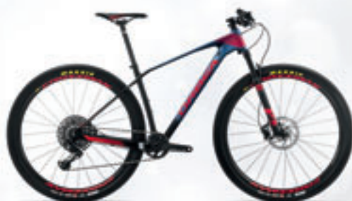
ORBEA // ALMANZ // 2.599€ >> 2.079€