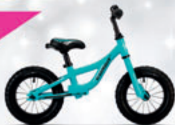
CONOR // ROLLING // 169€