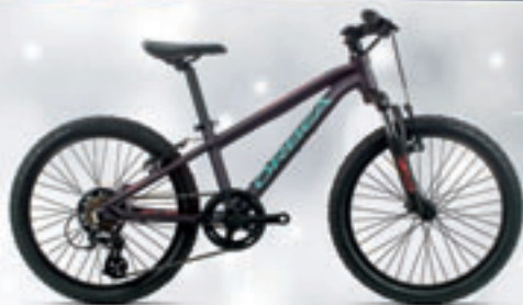
ORBEA // MIXTA // 329€