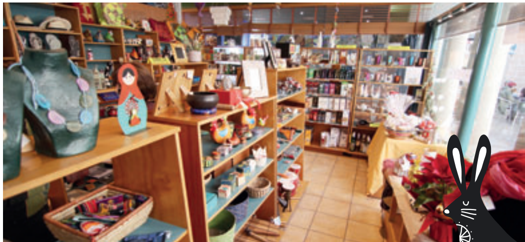
La Botiga Solidària és al número 50 del carrer Barcelona.