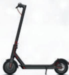
PATINET ELÈCTRIC // LEOPARD // 365€