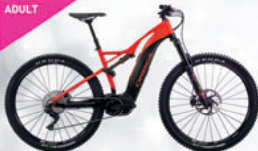
ORBEA // WILDPS // 4.529€ >> 3.450€